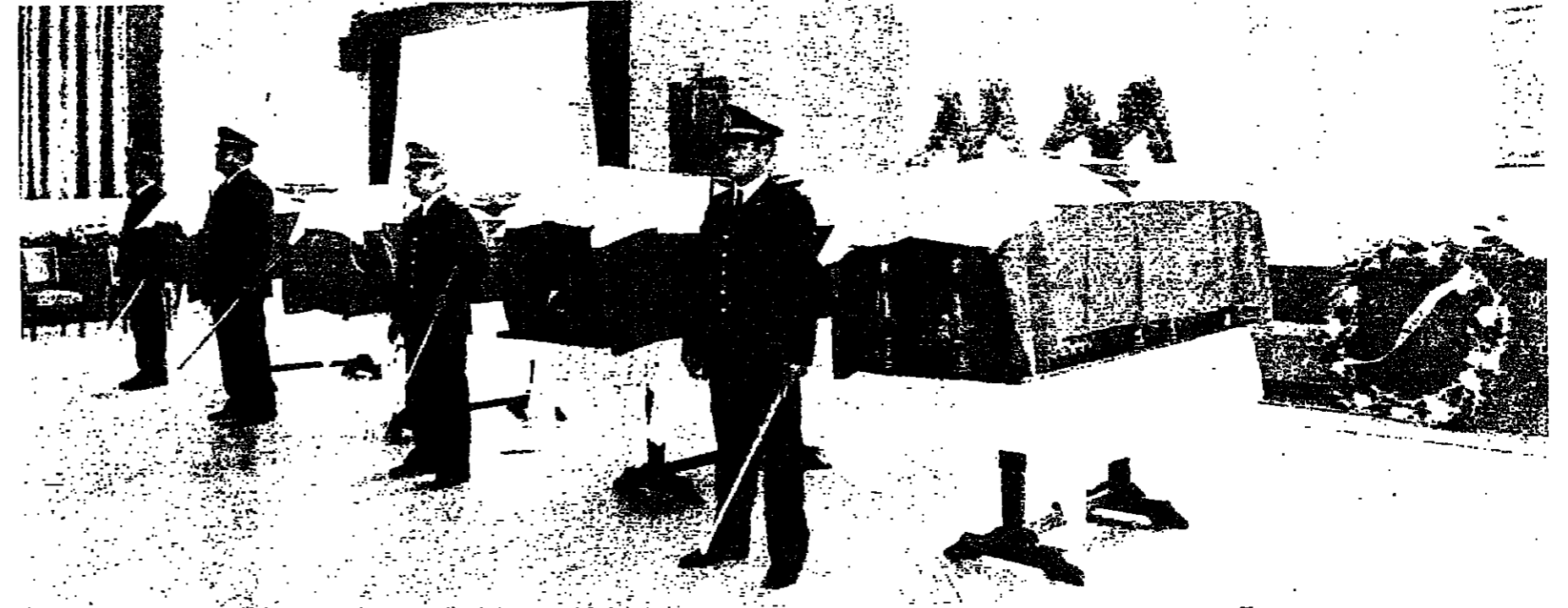
نعوش الشهداء الاربعه مسجاة والنادي العسكري بيروت بحراسه ضباط